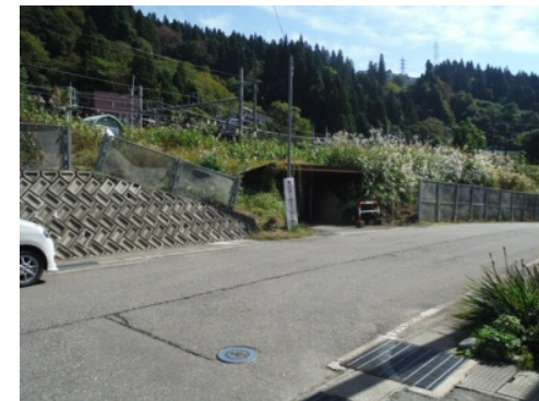
⑤つきあたりT字路を右折後、飯山線&上越線地下歩道を直進