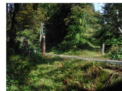
⑫道路を横断するポイントがありますので、車に注意してください