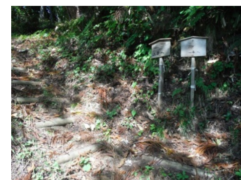
⑪一番観音から順に山を登って巡ります