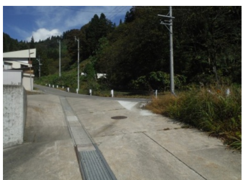
⑦地下歩道をくぐり道なりに進み、Y字路を右折