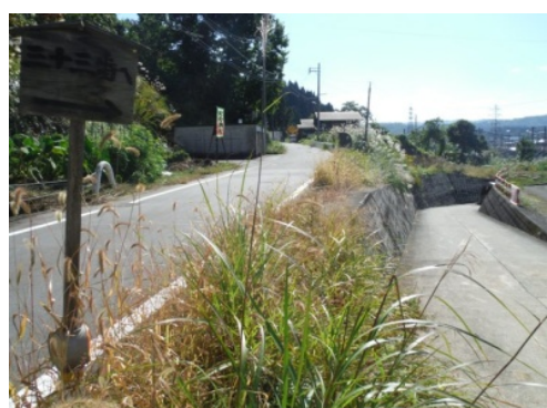
㉑三十二番観音を通過後、道なりに進み最初に来た地下歩道方面へ