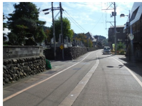
③「宝積寺」脇を左折し直進