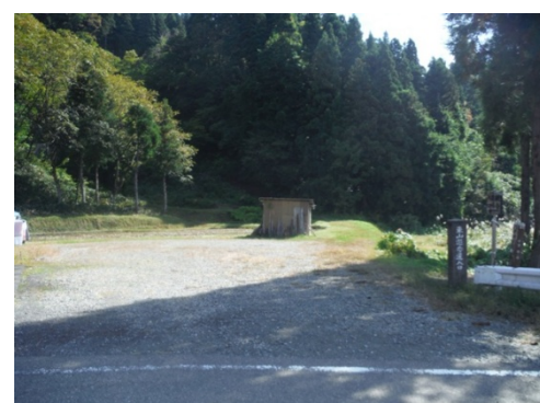
⑩入口には若干の駐車スペースがあります。小屋を横切って山へ