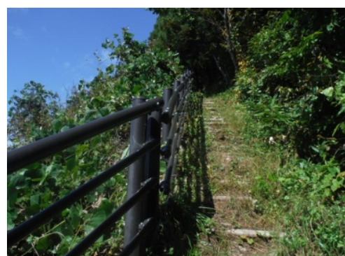
⑮頂上までは横を見ずに進みます