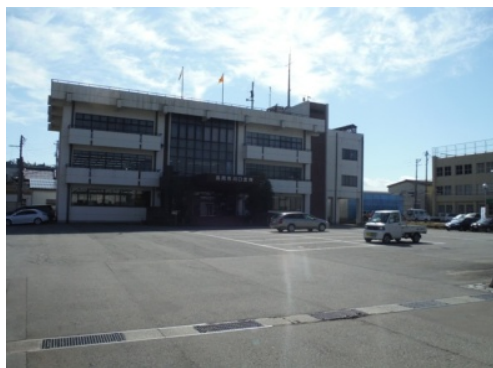
①川口支所前から出発。正面を右折し、越後川口駅方面へ直進