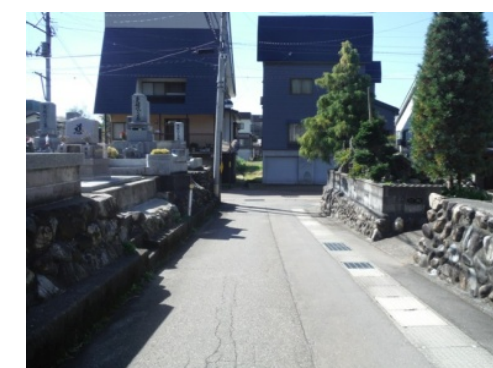
㉒地下歩道をくぐり右折、すぐに左折し直進後「宝積寺」脇を左折