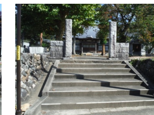
㉓三十三番観音が待つ「宝積寺」前入口に到着。お疲れさまでした！