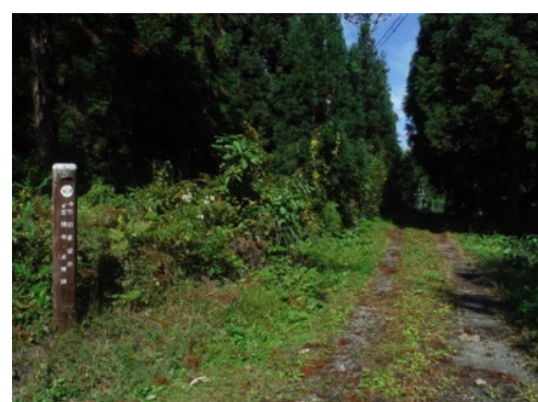
⑲頂上からは「竹田展望台」へとつながるルートもあります