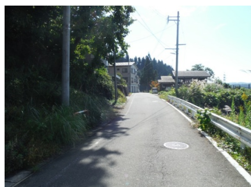
⑧しばらくそのまま直進