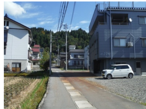
④「エリス美容室」を過ぎて十字路を渡り、しばらく直進