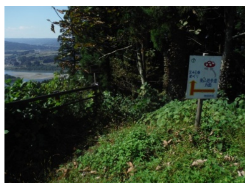
⑳引き続き三十三番めぐりのルートを進み十九番観音を目指します