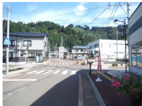
②「スーパー安田屋」を右折し「中島屋酒店」を通過後しばらく直進