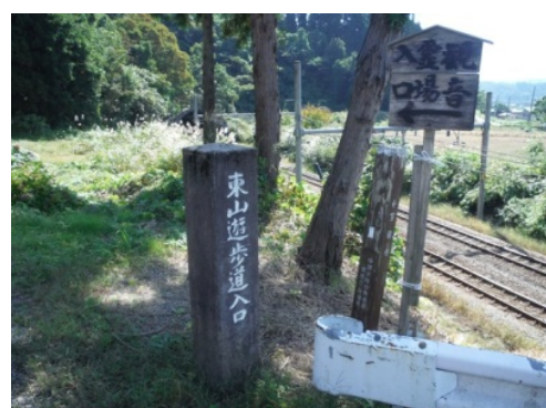
⑨三十三番観音霊場遊歩道入口に到着！