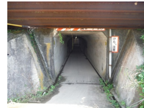
⑥天井が低いので通過の際は注意！