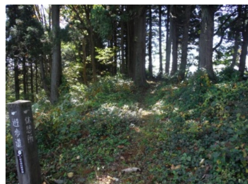
⑬途中の休憩ポイントで一休み♪