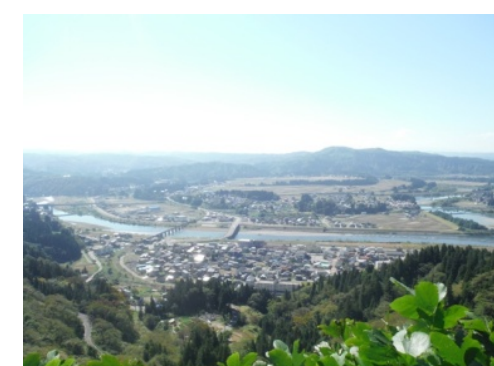
⑰目の前に広がる十八番からの絶景！