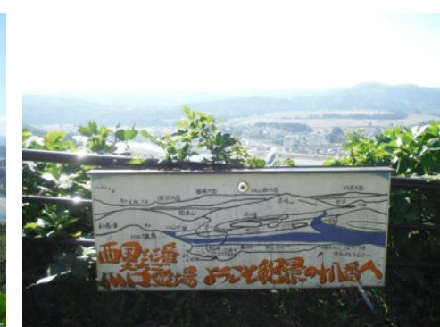
⑱手作り看板がみなさまを大歓迎