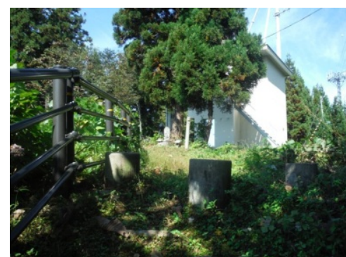
⑯ついに頂上へ到着！ゆっくりと左側に視線を向けてみると…