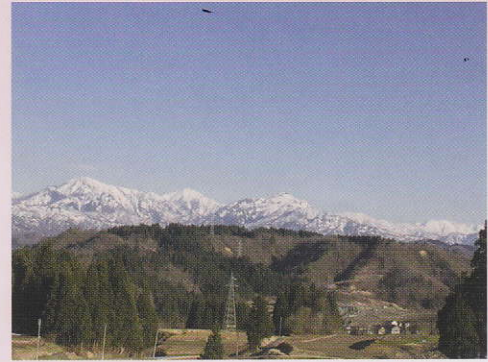
春の越後三山(駒ヶ岳・中ノ岳・八海山)